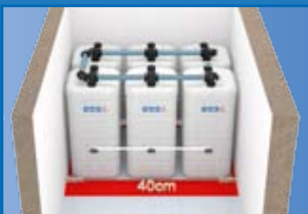
Minimierter Platzbedarf mit dem Sicherheits-Befüllsystem DE-A-01

DEHOUST Sicherheitszubehör DE-A-01 spart wertvollen Kellerraum.