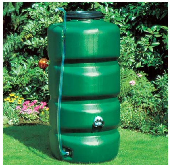
Beispiel 750 Liter