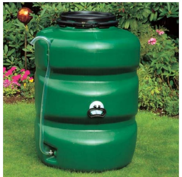
Beispiel 500 Liter