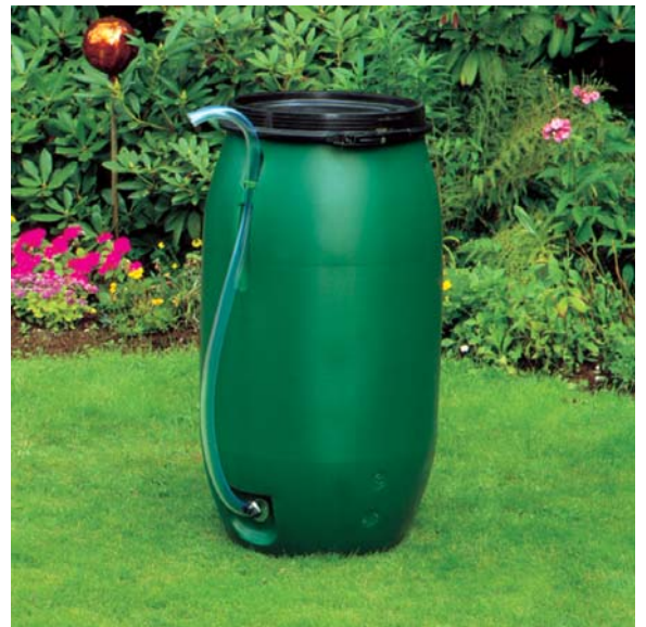
Beispiel 220 Liter

Die Behälter sind form- und farbstabil , witterungsbeständig und UV-geschützt .